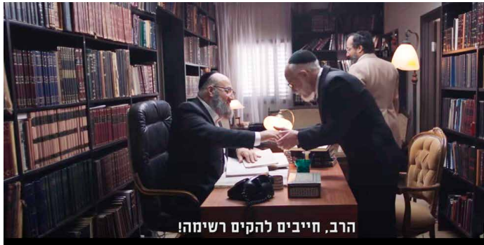
"הרב, חייבים להקים רשימה!". הבלתי רשמיים, בימוי: אלירן מלכה (ישראל 2018)

בגידתה של ש"ס בבוחריה ניכרת בפניו העצובות של יעקב. העסק שלו – עולמו הישן והבטוח – מתפרק, ואף לא אחד מההישגים שהיה רוצה עבור ביתו וחבריו הספרדים הושג. מלכה מוורא שהצופים רואים את החורבן מבעד לסמלים, כמו בית הדפוס הנטוש, מבטיהם המרוצים של העוברים ושבים ששמחים לאידו: המפלגה שהקים נגנבה ממש מתחת לאפו. אלירן מלכה, הבמאי, חשף לפני התקשורת: "כשקראתי ראיון עם מייסדי מפלגת ש"ס ב-1983, הבנתי בפעם הראשונה שיש עולם מקסים מאחורי המפלגה הזו שלא הכרתי. הרגשתי שזה יהיה מדהים להחיות את העולם הזה באמצעות סרט. הבלתי רשמיים הוא לא רק על ש"ס; הוא סיפור על פוליטיקה ואיך רעיונות יפים ומעוררי השראה מגיעים לסיומם במקום שנקרא פוליטיקה" 47 .