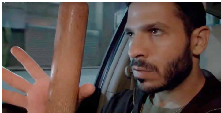
המשגיחים, בימוי: מני יעיש (ישראל 2012) 37

כבר בסצנת הפתיחה נראית השכונה העלובה שבה גרים בעלי התשובה. הקירות מכוסים בכרזות גזעניות ועליהן סיסמאות כמו: "אישה יהודייה חייבת להתחתן עם גבר יהודי". חסידי ברסלב, קבצנים "מקצועיים", סובבים בשכונה, מתמקמים בקרנות רחוב ואוספים נדבות כסף עבור הישיבה. הם אינם עובדים או מועסקים בעבודות פשוטות אלא עוסקים בהפצת דבריו של רבי נחמן מאומן. בהמשך מתברר שקבוצת הצעירים, גיבורי הסרט שהתאספו סביב הרב השכונתי, הם בעלי עבר בעייתי ואלים. כעת הם "עלו בדרגה" ובתפקידם החדש, בדומה למשמרות הצניעות אצל החרדים האשכנזים, הם שומרי מוסר. הם מקפידים לקיים את תפקידם נאמנה ובקנאות אלימה לא פחות מאשר בגלגולם