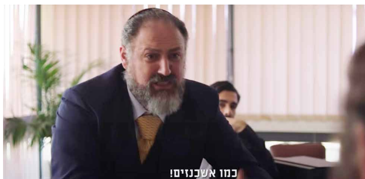
"פעם אחת ולהמיד אנחנו צריכים להתנהג כמו אשכנזים". הבלתי רשמיים, בימוי: אלירן מלכה (ישראל 2018)

הביקורת של היוצר משולבת בסרט כאשר בניהם של הגבירים החדשים נשלחים ללמוד בישיבות אשכנזיות, ואילו האב המסכן אינו מצליח להחזיר את ביתו לבית הספר האשכנזי וכמו רבים אחרים הוא נדחק לשוליים ורואה כיצד חלום האידיאל הספרדי-מזרחי המסורתי משתנה ונשחק לנוכח ההערפה להתקרב ככל האפשר לאליטה הרוחנית האשכנזית המחמירה ולעשות כדברה. 46 המסורת נעלמת ומוחלפת בחרדיות מעוותת.