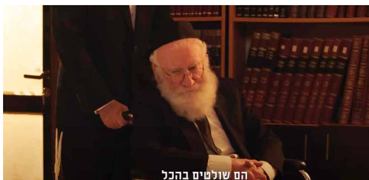
"הם שולטים בהכל". הבלתי רשמיים, בימוי: אלירן מלכה (ישראל 2018) 45

מגישים לו עוגה שהרב (האשכנזי החשוב) בירך אותה, והוא, שתחילה מסרב לאכול, טועם את העוגה בהתלהבות רבה, כאילו התברכה על ידי אלוהים. האופן שבו הרב החביב מבטל את עצמו מעורר בצופה רחמים וכעס עם הנהון של הסכמה שסצנה זו אכן מסכמת את יחסי הכוחות בין הצדדים.